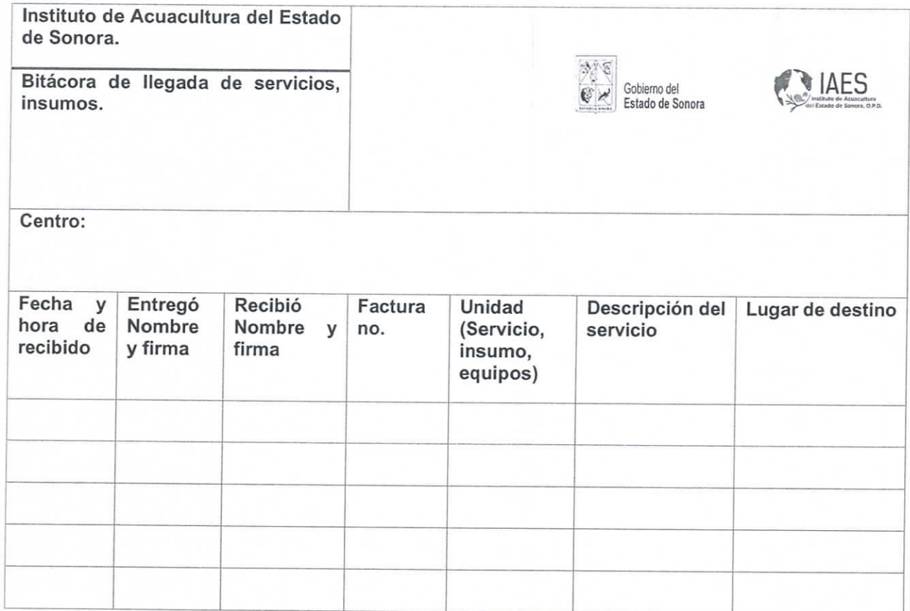
Tabla 6. Bitácora de entrega de servicios, insumos, materiales.